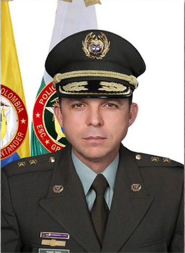
Juan Carlos Buitrago

General (Ret.) Policía Nacional de Colombia.